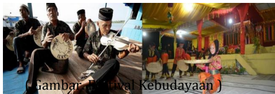
Gambar Festival Kebudayaan

mempengaruhi opini publik. Beberapa jenis kegiatannya termasuk Callender Event, Special Event, Festival Event , Salah satu cara yang dinilai menarik untuk membuat wisatawan tertarik untuk mengunjungi Pulau Banyak adalah dengan melaksanakan dan mengikuti pagelaran, pameran budaya, seni dan objek-objek wisata. Baik yang dilaksanakan sendiri oleh Dinas Pariwisata Pemuda dan Olahraga Kabupaten Aceh Singkil maupun kegiatan yang merupakan bentuk kerjasama dengan pemerintah pusat atau swasta, Masyarakat bahkan dengan mahasiswa.