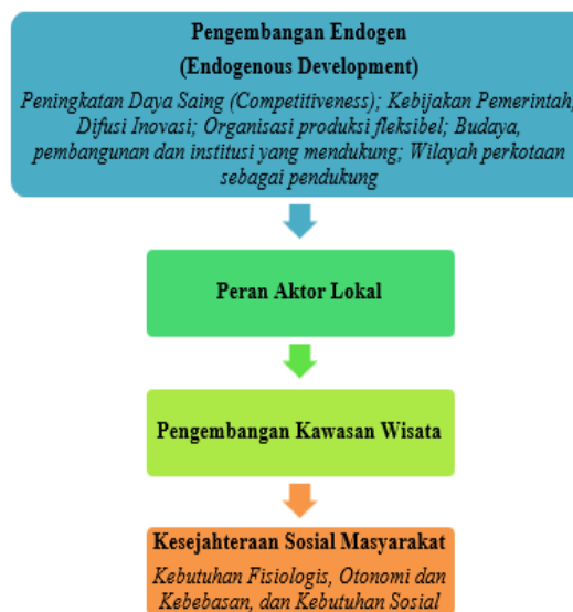
Bagan 1. Alur Pikir Penelitian

Berdasarkan teori-teori yang telah di satu padukan, terdapat alur berpikir untuk memudahkan dalam melakukan penelaahan, sebagai berikut