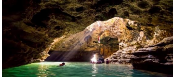
Gambar 8. Sumur Eluh Berru Tinam

Sumur Eluh Berru Tinambunen mempunyai pesona berbeda dan alam sekitar yang terjaga baik membuat semua kecantikan menjadi satu. Lokasinya di Rumerah, Kec. Sitellu Tali Urang Julu, Kab. Pakpak Bharat.