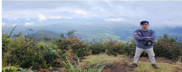
Gambar 11. Sibande

Sibande termasuk salah satu kecamatan dengan penataan lokasi sangat epik. Bukan hanya itu karena keindahan kecamatan yang satu ini terlingkupi oleh pemandangan alam super cantik. Bahkan biasa merasakan kenikmatan durian asli Sumatera yang tiada duanya. Wisatawan di sarankan berlibur kesini saat musim durian datang sebab harga buah tropis ini akan sangat murah serta bisa pesta bersama dengan penduduk sekitar. Lokasi Simberuna, Kec. Sibande, Kab. Pakpak Bharat.