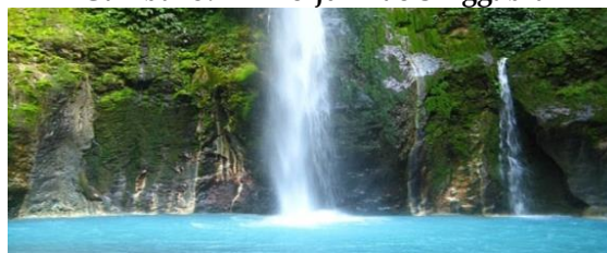
Gambar 3. Air Terjun Lae Singgabit

Air Terjun Lae Singgabit yang berada di Desa Mahala, Kecamatan Tinada. Pada dasarnya disini wisatawan bisa memilih lebih dari 3 wisata alam yang semuanya air terjun. Tidak kalah dari jenis wisata lainnya. Disini wisatawan bisa melihat karakteristik air terjun yang memesona akan deburan air jernih. Air Terjun Lae Singgabit bukan hanya sekedar tempat wisata. Namun, tempat refleksi diri untuk lebih menikmati penciptaan Tuhan.