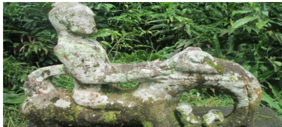
Gambar 9. Batu Tettal

Batu Tettal menjadi salah satu peninggalan purbakala yang dilindungi bahkan kawasan dibuat sedemikian rupa hingga wisatawan bisa nyaman didalamnya. Untuk menikmati semua pengalaman luar biasa tersebut wisatawan cukup mengeluarkan biaya tiket masuk. Lokasi Jambu Rea, Kec. Siempat Rube, Kab. Pakpak Bharat.