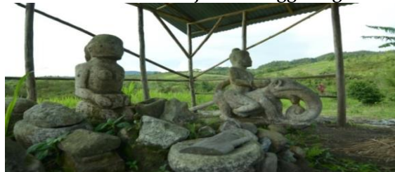
Gambar 10. Mejan Penanggaleng

Peninggalan purbakala ini terbuat dari batu dan menggambarkan kebudayaan serta kehidupan di zaman dulu dan di sekitar kawasan budaya wisatawan bisa melihat bagaimana alam masih begitu asri hingga menciptakan udara sejuk. Pengunjung tidak