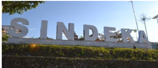
Gambar 13. Puncak Sindeka