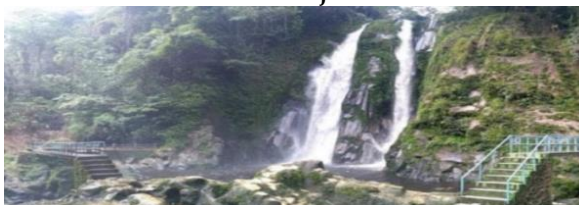
Gambar 4. Air Terjun Simbilulu

Pengunjung dapat menikmati pengalaman unik di Air Terjun Simbilulu dengan melihat dua sisi air dari ketinggian 4 meter. Kawasan sekitar air terjun juga sangat mengisyaratkan bahwa semuanya masih dalam kondisi baik. Hal lain yang harus dilakukan adalah menikmati semua keindahan alam untuk mengalihkan pikiran Anda