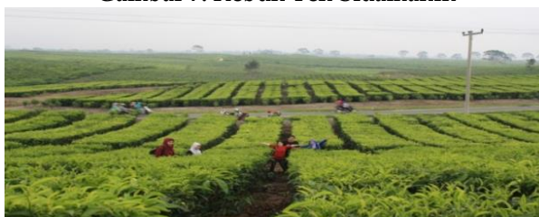
Gambar 7. Kebun Teh Sidamanik

Berbeda dari kebun teh pada umumnya, disini wisatawan diperbolehkan untuk menikmati secara dekat pemandangan alam tanpa harus membayar tiket masuk.