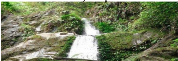
Gambar 2. Air Terjun Sipitu Lae Petulan

Air Terjun Sipitu Petulan, kondisi tempat wisata yang satu ini lebih tenang dimana air mengalir lancar dengan debit tak terlalu deras sehingga, wisatawan bisa langsung mandi dibawah air terjun. Berada di Dusun Lebbuh, Desa Kuta Jungak. dan termasuk lokasi yang mudah dicapai.