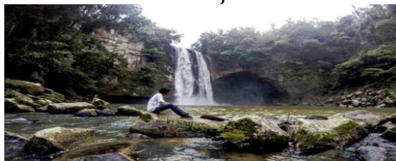
Gambar 6. Air Terjun Tonduhan

Hampir sama dengan air terjun lain yang memenuhi diri akan deburan air nan jernih. Air Terjun Tonduhan juga memberi pengalaman berbeda saat mandi dan memandangnya. Belum lagi suasana sejuk dari lingkungan yang terjaga asri. Lokasi Kecupak I, Kec. Pergetteng-Getteng Sengkut, Kab. Pakpak Bharat.