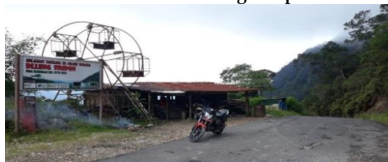
Gambar 15. Delleng Simpon

Objek wisata yang cocok bagi pecinta alam dan suka mendaki. Delleng Simpon bisa jadi alternatif liburan paling tepat. Bahkan bagi para pemula sangat dianjurkan karena berbeda dari gunung pada umumnya. Sebab, disini wisatawan bisa merasakan pendakian yang tidak terlalu tinggi. Sehingga proses untuk mencapai puncak tak membutuhkan waktu lama. Lokasi Ulumerah, Kec. Sitellutali Urang Julu, Kab. Pakpak Bharat.