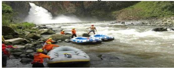
Gambar 14. Rafting Lae Kombih

Pecinta tantangan alam, Rafting Lae Kombih bisa jadi solusi paling tepat. Semua fasilitas sudah disediakan oleh pengelola. Wisatawan juga bisa memulai kegiatan rafting di Lae Kombih yang terkenal akan deburan air super. Bahkan pemandangan disekitar lokasi mampu membuat betah untuk berlama-lama. Poin tambah yang juga tak boleh tertinggal ialah kemudahan akses sekaligus tiket masuk dengan harga terjangkau. Lokasi Kecupak, Kec. Sitellu Tali Urang Julu, Kab. Pakpak Bharat.