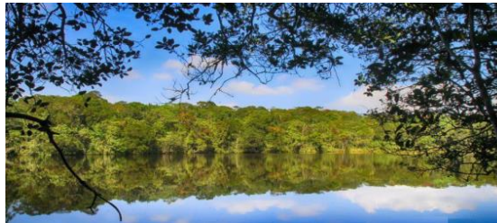
Gambar 12. Sicike Cike

Salah satu kawasan hutan wisata yang menyediakan kejutan alam pemandangan sungai jernih dan didalam hutan dapat melihat ribuan flora dan fauna yang masih terjaga dengan sangat baik. Lokasi Lae Hole II, Kec. Parbuluan Kab. Pakpak Bharat.