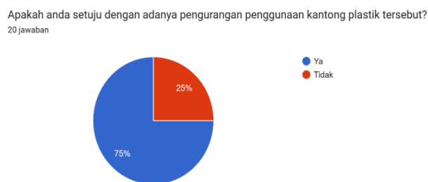
Gambar 2. Pendapat responden dengan adanya pengurangan penggunaan Kantong di Kota Surabaya

Kurangnya komunikasi Pemerintah dengan masyarakat dapat menjadi salah satu kendala dari jalannya peraturan tersebut, selain hal tersebut kesadaran masyarakat secara pribadi terhadap dampaknya pun sangat dibutuhkan, dalam diagram diatas sebanyak lima belas responden (75%) mengatakan bahwa setuju dengan adanya program Zero Waste dalam hal ini pengurangan penggunaan kantong plastik, dengan catatan bahwa adanya solusi yang solutif dari pemerintah untuk mengurangi sampah kantong plastik, karena pada dasarnya responden memahami secara pribadi dampak dari sampah tersebut, tapi terdapat lima responden (25%) mengatakan bahwa tidak setuju dengan adanya program tersebut, dikarenakan program tersebut menyasar kepada masyarakat yang aktif berbelanja di pasar sehingga sangat mustahil tidak menggunakan kantong plastik untuk berbelanja.