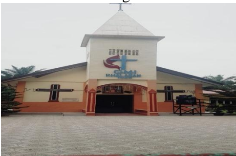
Gambar 1. Gereja GMI PADANG HALABAN

Gereja Methodist Padang Halaban, Labuhan Batu Utara, di Sumatera Utara berdiri hampir sudah seratus tahun lamanya yakni semenjak tahun 1926. Di awal berdirinya, 13 KK jemaat bergabung dan mendirikan gereja ini di tahun tersebut, sampai saat ini gereja telah bertumbuh dan memiliki jemaat sebanyak 66 KK dengan jumlah umat sekitar 200-an orang.