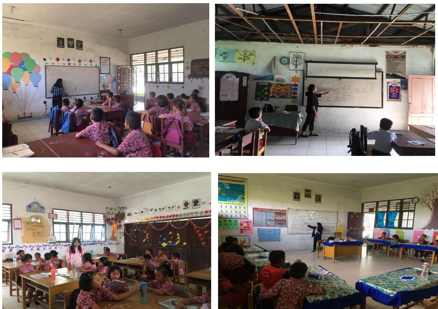
Gambar 3. Kegiatan Pembelajaran Berbasis Literasi di Kelas I-IV

Jurnal Pengabdian Kepada Masyarakat MAJU UDA Universitas Darma Agung MEDAN