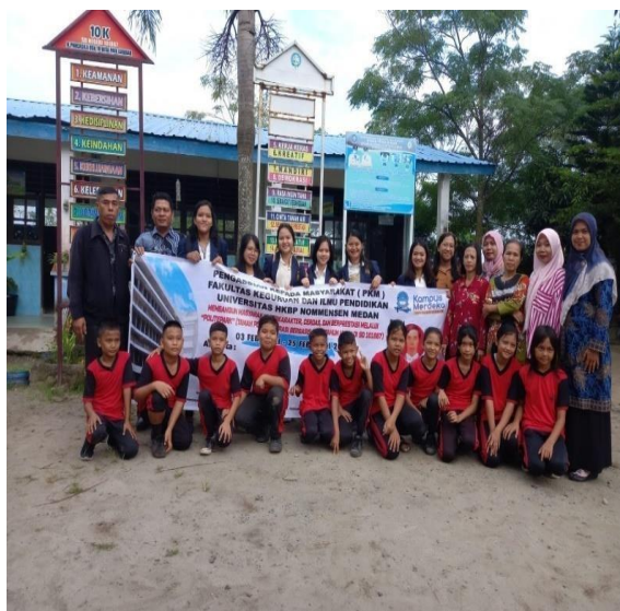
Gambar 1. Pengantaran Mahasiswa Pengabdian kepada Masyarakat di SD Negeri 101867 Paya