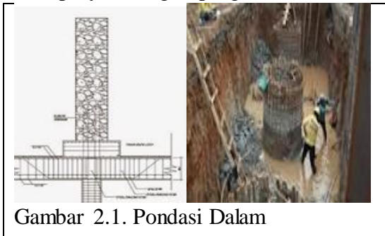
Gambar 2.1. Pondasi Dalam

Misalnya daerah proyek tidak dapat dilalui truk angkut tiang pondasi sehingga dilakukan pembuatan pondasi dalam di lokasi proyek dengan pengeboran.