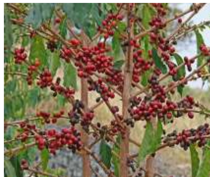
Gambar 2.1 Tanaman Kopi

Kata kopi sendiri awalnya berasal dari bahasa Arab : qahwah yang berarti kekuatan, karena pada awalnya kopi digunakan sebagai makanan berenergi tinggi.. Kata qahwah kembali mengalami perubahan menjadi kahveh yang berasal dari bahasa Turki dan kemudian berubah lagi menjadi koffie dalam bahasa Belanda . Penggunaan kata koffie segera diserap ke dalam bahasa Indonesia menjadi kata kopi yang dikenal saat ini.