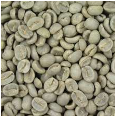
Gambar 2.2. Biji Kopi

Biji kopi adalah biji dari tumbuhan kopi dan merupakan sumber dari minuman kopi. Warna bijinya adalah putih dan sebagian besar berupa endosperma . Setiap buah umumnya memiliki dua biji. Buah yang hanya mengandung satu biji disebut dengan peaberry dan dipercaya memiliki rasa yang lebih baik.