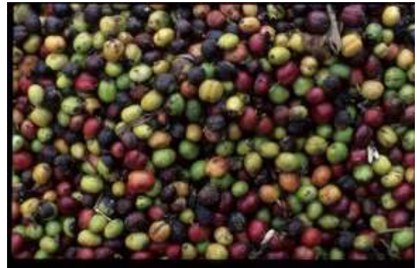
Gambar 2.4 Buah Kopi Yang Sudah Masak

dibasahi dahulu untuk memudahkan pememaran, setelah kulit terlepas, biji-biji kopi direndam dalam air selama 3-6 hari. Sesudah itu biji kopi yang masih berkulit ari dibersihkan lalu dijemur, setelah kopi kering kemudian di tumbuk lagi agar kulit arinya lepas, lalu ditampi, seperti terlihat pada