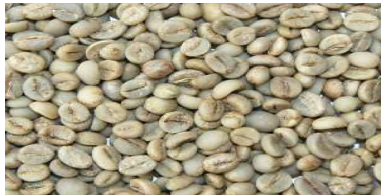
Gambar 2.5 Biji Kopi Yang Masih Berkulit Ari