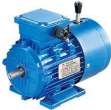
Gambar 2.6 Motor Listrik

Motor berfungsi untuk memutar poros pemutar mesin pengupas dan sumber penggerak utama dalam proses pengupasan kulit ari biji kopi.