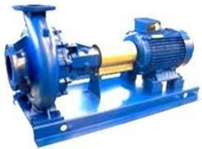
Gambar 2. Mesin Fluida (Pompa Sentrifugal)

Pompa sentrifugal adalah pompa tekanan dynamis yang menggunakan konsep kecepatan tekanan untuk menaikkan tekanan kerja fluida, dimana poros merupakan tempat kedudukan impeller yang dilengkapi dengan vanes (sudu-sudu). Impeller biasanya diputar dengan memakai motor dan diselubungi oleh rumah pompa ( casing )/